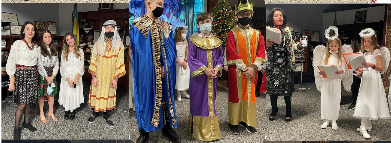
St. Nicholas Program in "Ridna Shkola"