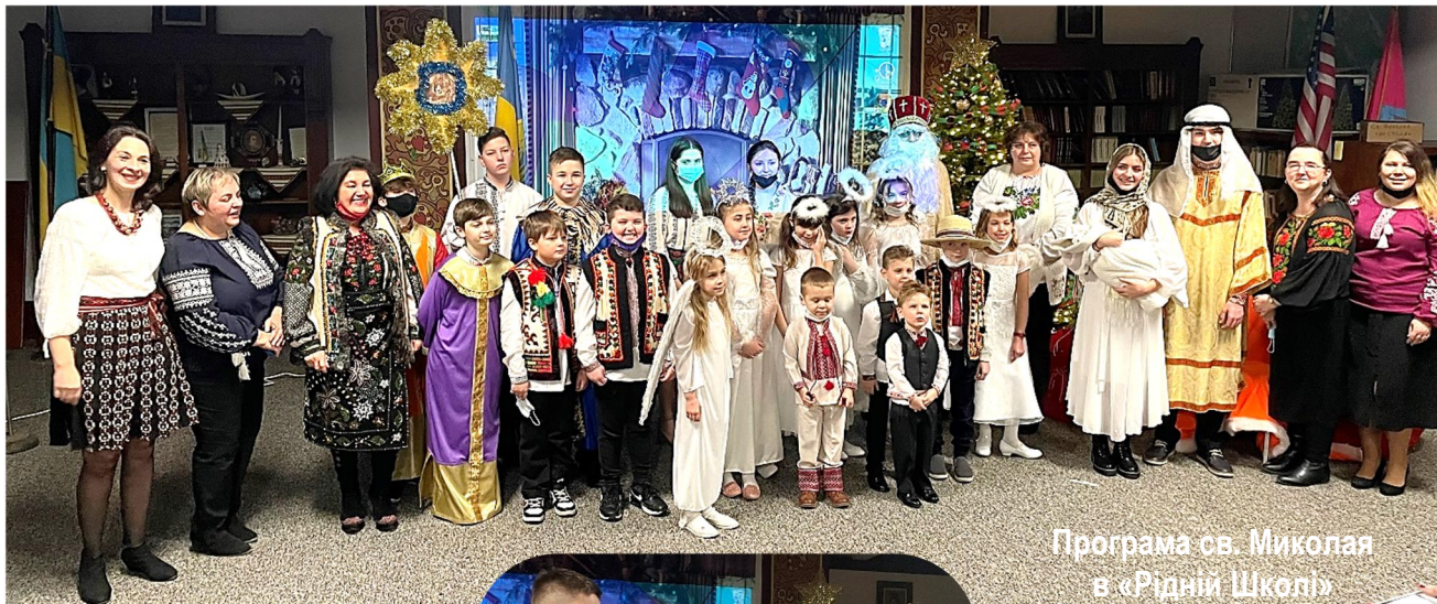
Програма св. Миколая в «Рідній Школі»