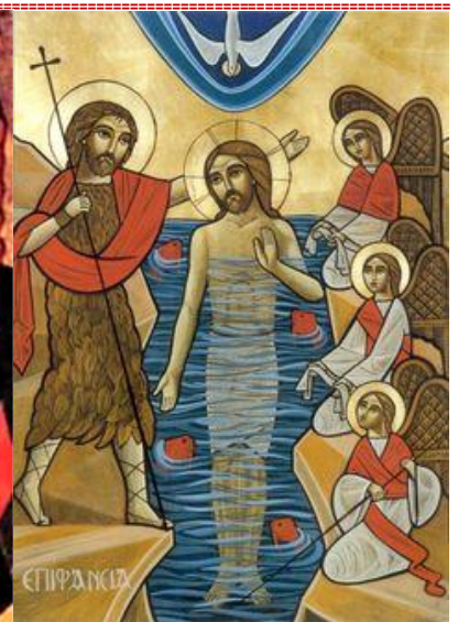
Coptic icon - Holy Baptism

Please note: Christmas Eve Liturgy will be streaming live from St. Nicholas Church tomorrow night, January 6, at 11 PM. Go on our web page and click to the link for streaming.