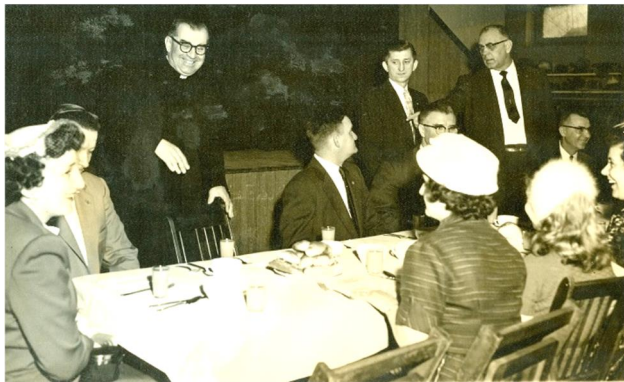
No. 49. From the archives: Anybody you know? 3 apxibib.

----- From last Bulletin: (Photo No. 48)