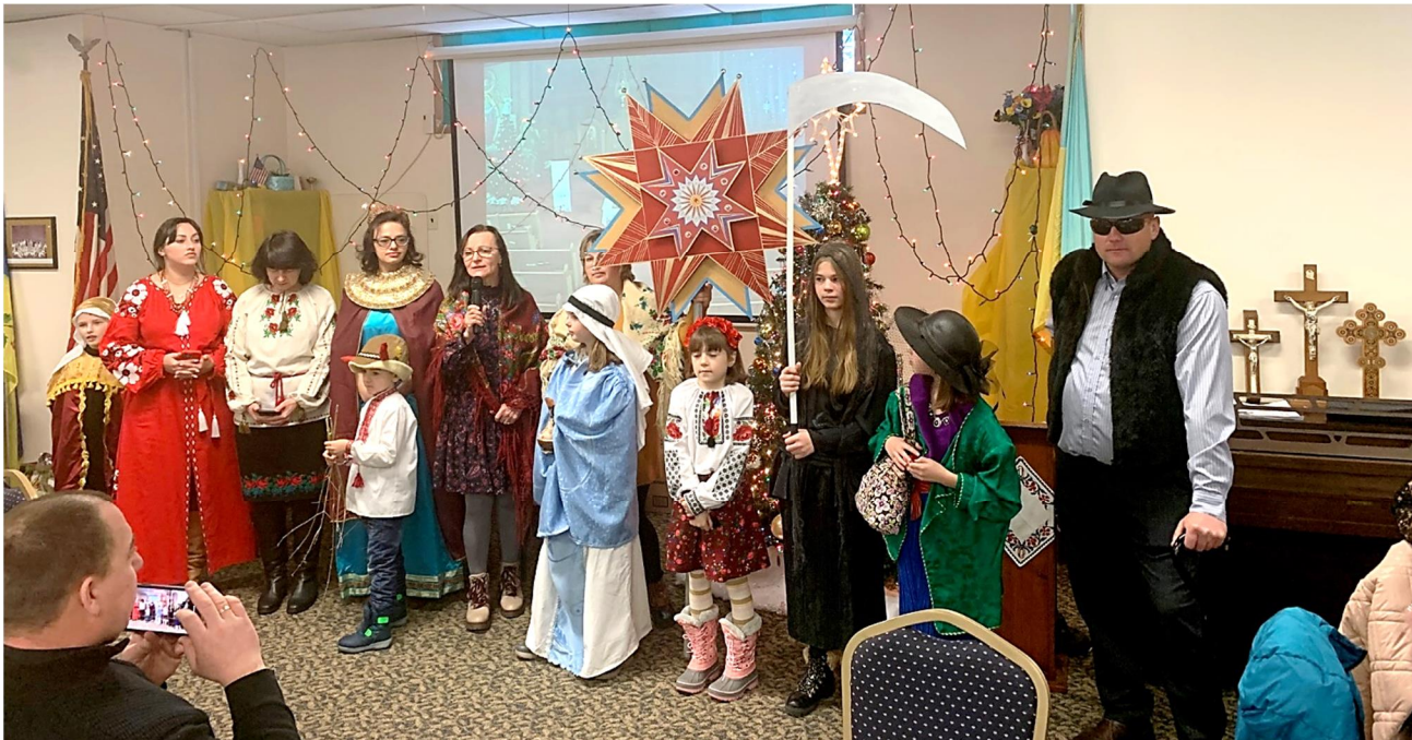
Thank you, carolers for caroling for the needs of Ukraine! *** Дякуємо колядникам, що колядували на потреби України!

Коляда дзвіночком, хоч війна вирує. Б'ється Україна, але колядує. Всі ми зачекались перемоги днини, Щоби повернулись рідні із чужини. Україна каже: «Діти, мої діти, У серцях будемо всі разом радіти. Бог нам подарує мир, любов, добро». Христос ся рождає! Славимо Його!