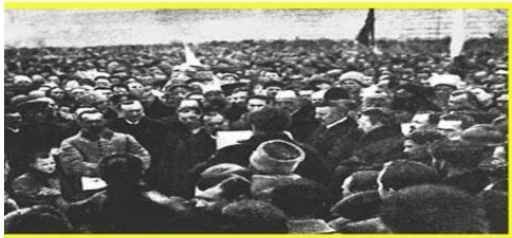
Ambassador Lonhyn Cehelsky, its author, proclaims the Act of Unity

"From this day forth, the Ukrainian National Republic becomes independent, subject to no one, a Free, Sovereign State of the Ukrainian People."