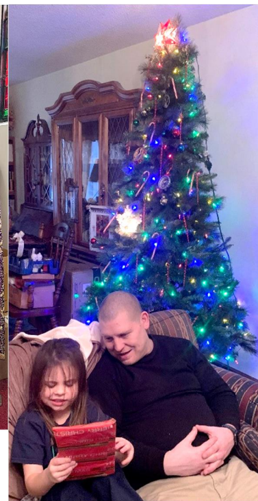
Gifts are always nice to receive. Bring smiles.

ХРИСТОС РАЖДАЄТЬСЯ! СЛАВИТЕ ЙОГО! CHRIST IS BORN! GLORIFY HIM!