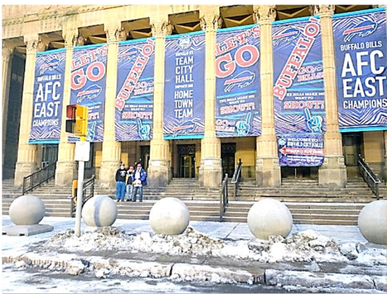
Go, Bills!!! – До перемоги!!! Water Blessing – Водосвяття. →