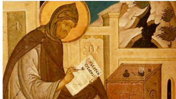
Venerable Ephrem the Syrian. Feastday – January 28. Преподобний Єфрем Сирий. Празник – 28 січня.

10:00 p. For Parishioners. – За Парохіян