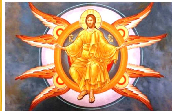
Ікона взята з «Дивен Світ» 2.5.2023, Наталія Павлишин

✠ № 05 ✠ F E B R U A R Y 0 4 ✠ 2 0 2 4 ✠