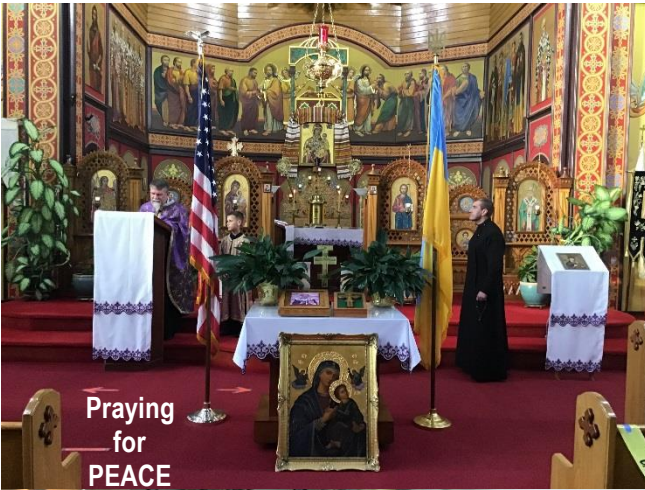
Praying for PEACE