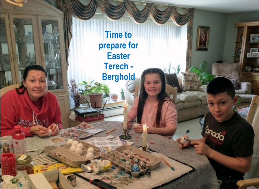
Time to prepare for Easter Terech - Bergold