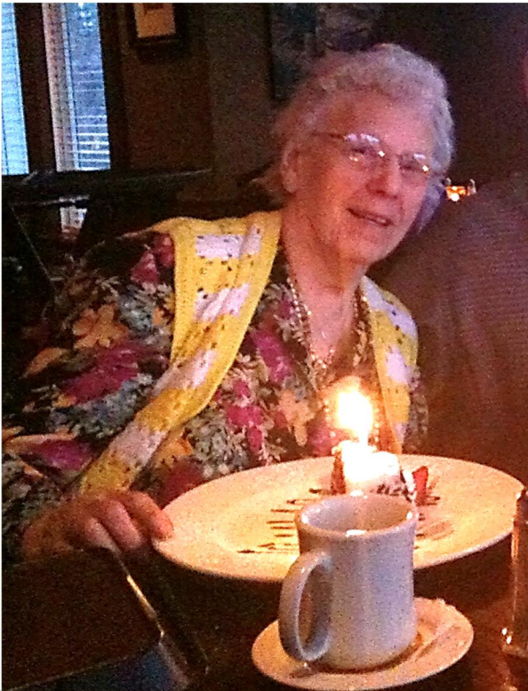
Many Happy Years – 101 – Многая Літа! Хай Господь щедро благословить!