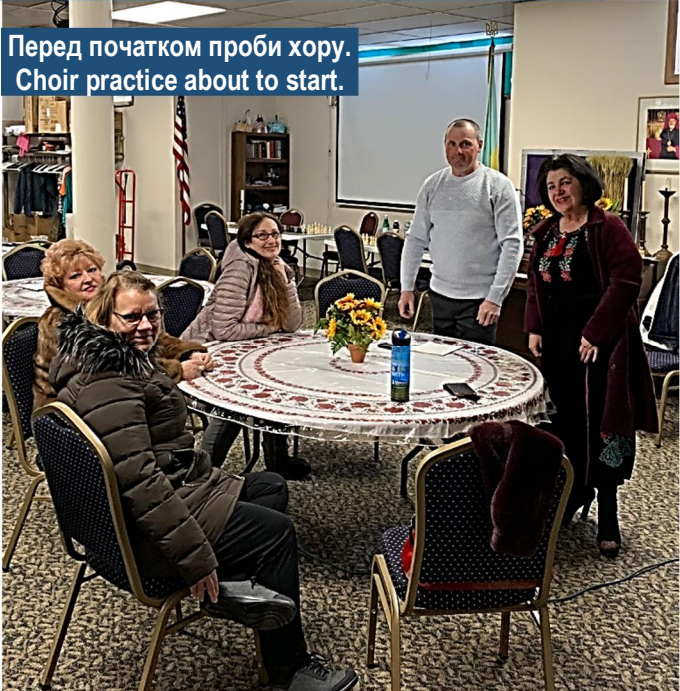
Перед початком проби хору. Choir practice about to start.