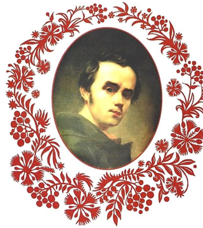
Тарас Шевченко (1814-1861)