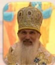
Bishop Benedict Aleksyichuk