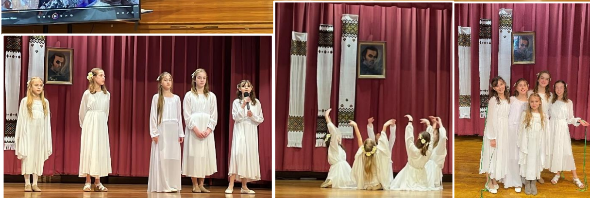
Святкова Академія, присвячена 210-ій річниці з дня народження Тараса Шевченка – 10 березня, 2024