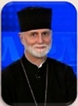
Archbishop Borys Gudziak