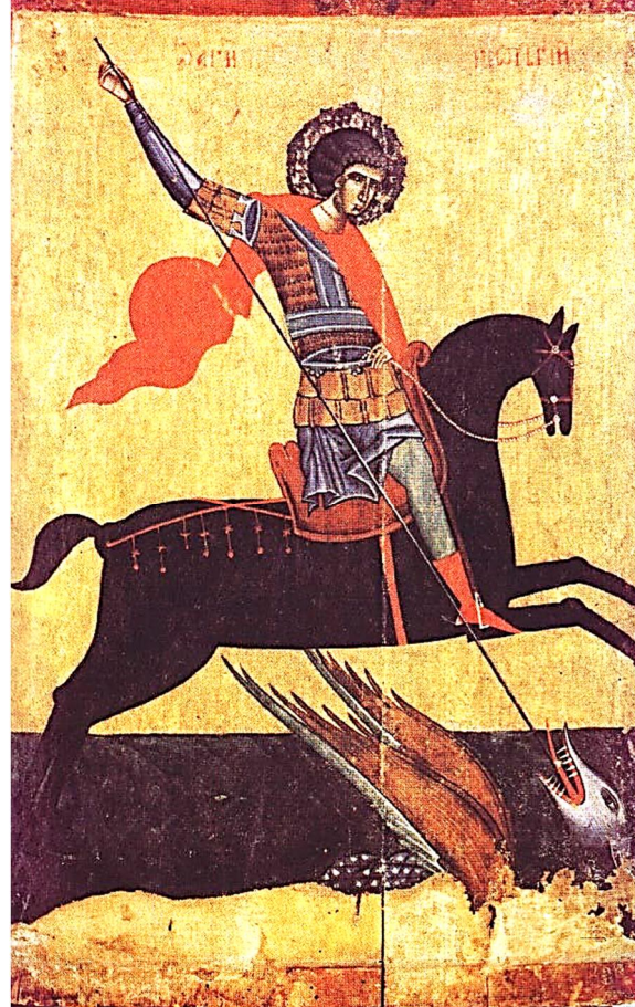
Св. Юрій – St. George XIII c. - (April 23, Gr. cal.)

25 квітня: КВІТНА НЕДІЛЯ 10:00 р. For Parishioners - За парохіян По Українськи ~ STREAMING