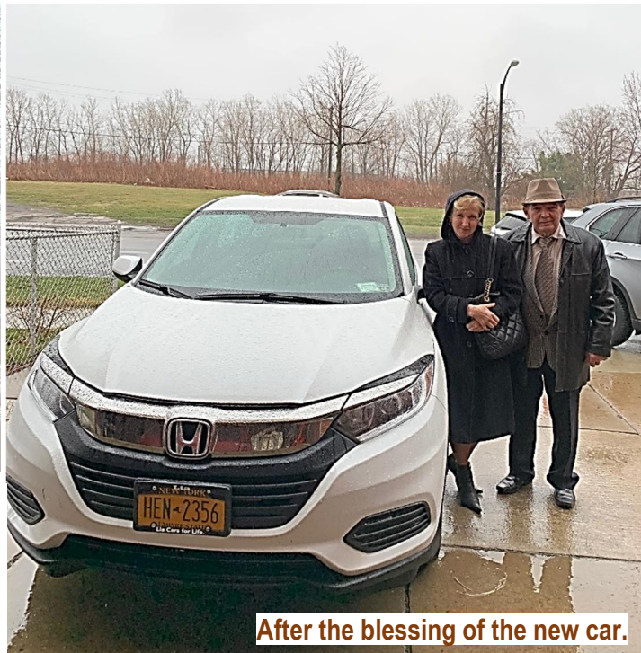
After the blessing of the new car.

We are in need of your pictures from anniversaries, birthdays or whatever occasion might be. Thank you!