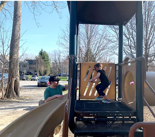
And we will go down the slide...

We are in need of your pictures from anniversaries, birthdays or whatever occasion might be. Thank you!