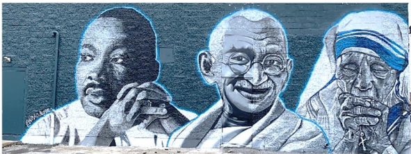
Martin Luther King, Mahatma Gandhi and Mother Theresa – at the corner of William and Fillmore