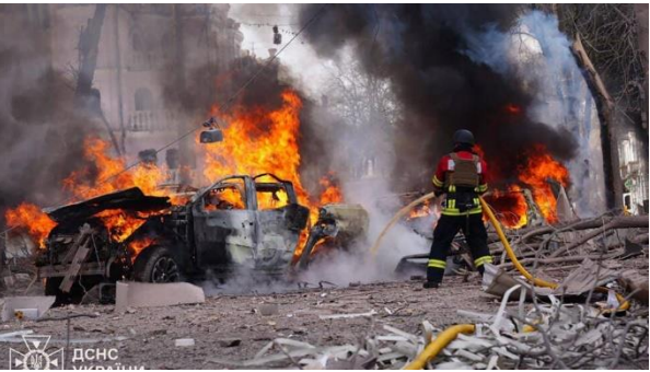
Ukrainian Emergency Service rescuers works to extinguish a fire at the site of a missile attack in Sumy, northeastern Ukraine. April 13, 2025

Ukraine on Edge After Russian Strike; Zelensky Issues Grim Warning. The Ukrainian leader says the security of the entire world is at stake. (M. Bociurkiw)