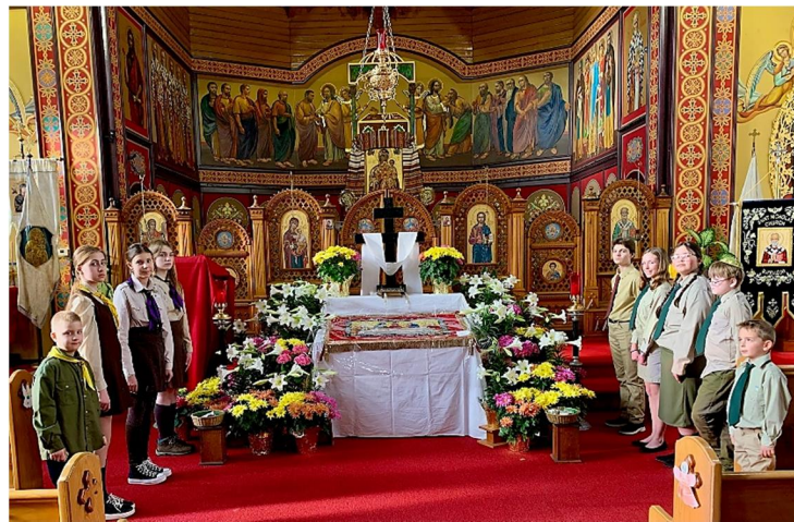
ДЯКУЄМО ПЛАСТУНАМ І СУМІВЦЯМ, ЩО ТРИМАЛИ СТІЙКУ!

Сердечна подяка о. Андрієві Тарасові Двудіт за цьогорічні реколекції – місії, і слухання сповідей. Хай Господь щедро благословить о. Андрія і його Родину!