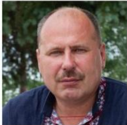
Свобода для людей!