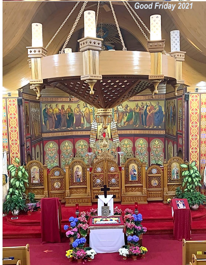
Good Friday 2021