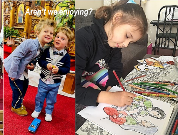
Aren't we enjoying?