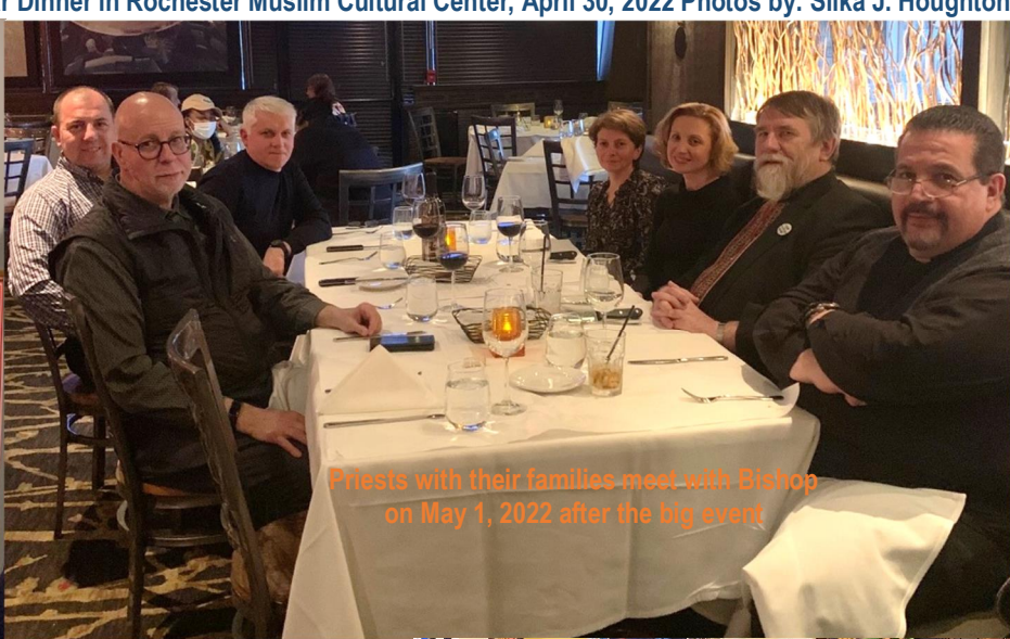
Priests with their families meet with Bishop on May 1, 2022 after the big event