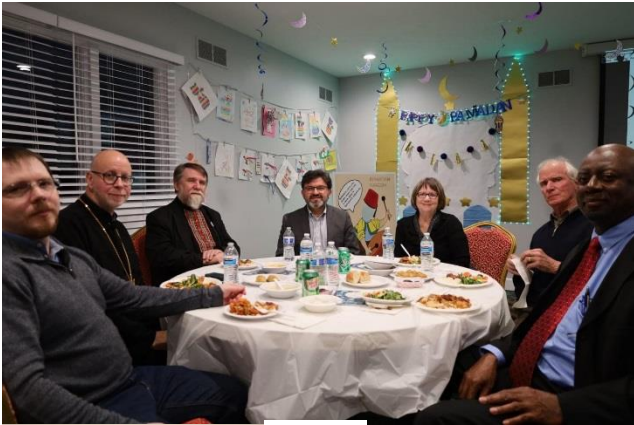
From Iftar Dinner in Rochester Muslim Cultural Center, April 30, 2022