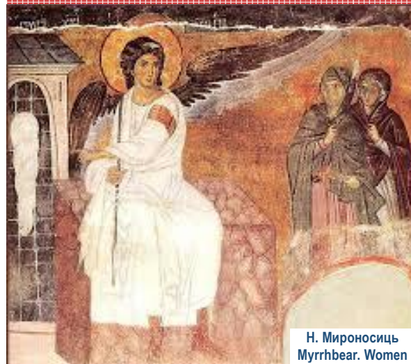
Н. Мироносиць Myrrhbear. Women S. of Paralyzed Man Неділя Розслаб.