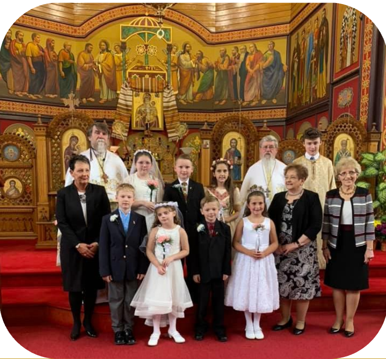
Торжественне Святе Причастя - 5 Травня – 2019 – May 5 - Solemn Holy Communion