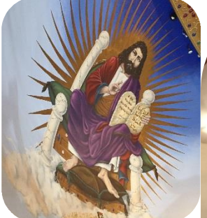
International Rosary, St. John Maro - May 1, 2019