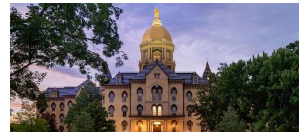
Будівля University of Notre Dame у Саут-Бенді (Індіана)

– УКУ та Університет Нотр-Дам – плідно співпрацюють більше ніж 15 років, проводячи обміни та навчання для науковців і працівників.