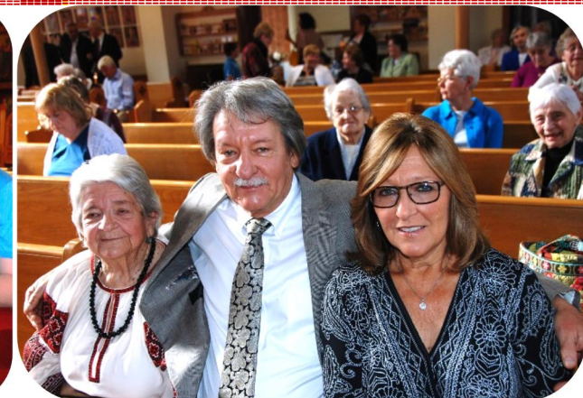
Сердечна подяка катехиткам, за приготування сніданку з нагоди Дня Матері. Хай Господь благословить! Многая Літа!