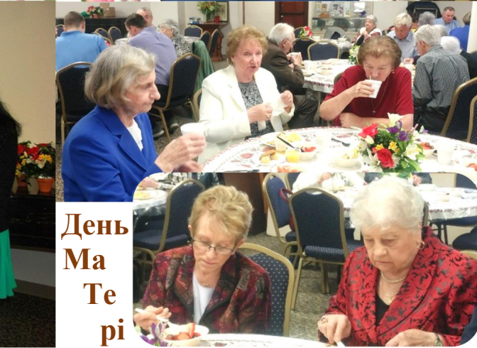
День Ма Те рі