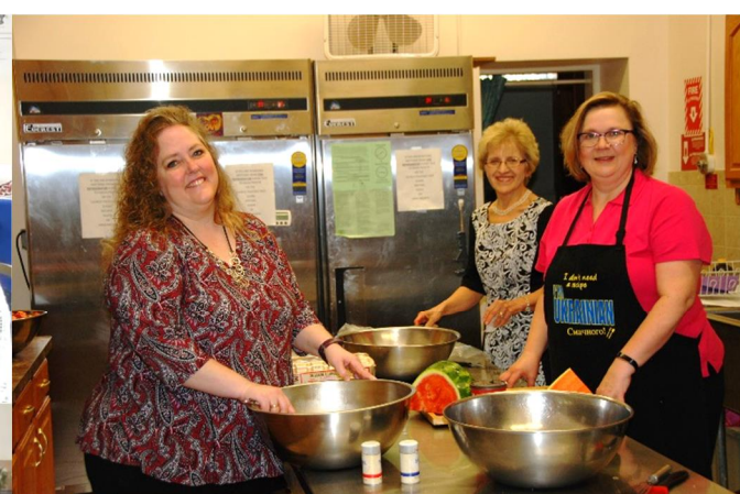
Thank You, Catechists, for preparing Mother's Day breakfast!