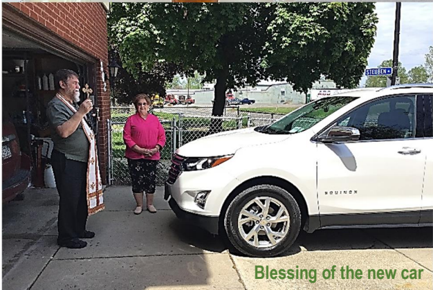
Blessing of the new car

We are in need of your pictures from anniversaries, birthdays, graduations or whatever occasion it might be. Thank you!