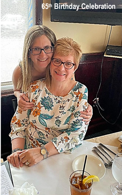
65 th Birthday Celebration