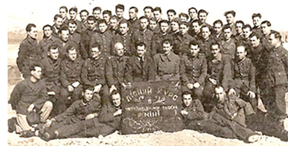
Українці в «СЕР» таборі (Ріміні, Італія), 29 березня 1946 р.,

Приватний Секретар Королеви дістав завдання підтвердити одержання листа Пана Софрона від 26 жовтня 1946, який, на доручення Її Величності, був переданий до відповідного відомства.