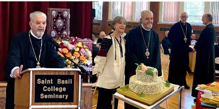
Bishop Basil Losten on 50 Anniversary of Bishop's Consecration