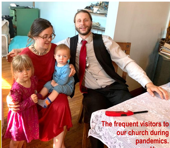
The frequent visitors to our church during pandemics. Happy birthday!