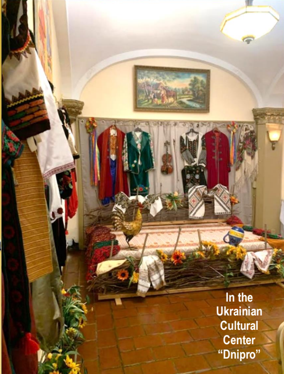
In the Ukrainian Cultural Center "Dnipro"

SAINT NICHOLAS UKRAINIAN CATHOLIC CHURCH