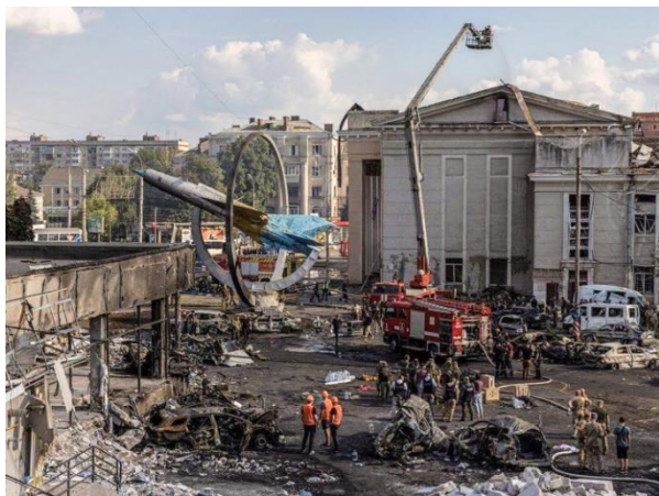
Наслідки ракетного удару по Вінниці, 14 липня 2022 року

Український народ найбільше нині плаче за невинними жертвами Вінниці. Учора вінницькі центральні площі та вулиці були залиті людською кров'ю. Серед загиблих – троє дітей. Ми бачили ці бездиханні дитячі тіла на руках убитих горем матерів... Про це сказав Отець і Глава Української Греко-Католицької Церкви Блаженніший Святослав у своєму щоденному воєнному зверненні у 142-й день повномасштабної війни росії проти України.