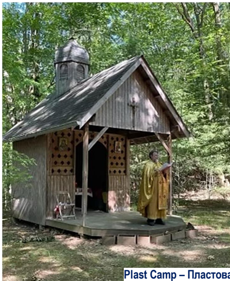
Plast Camp – Пластова Оселя «Новий Сокіл»

July 17 – 2022 – 17 липня ЦЕРКОВНИЙ ВІСНИК