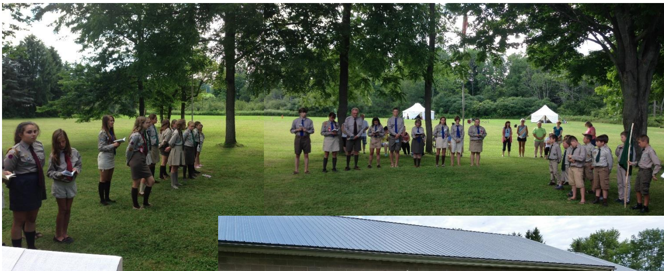
На Сумівській Оселі «Холодний Яр»