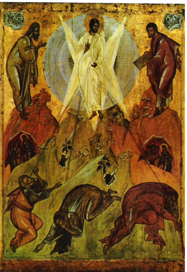
Transfiguration - Переображення