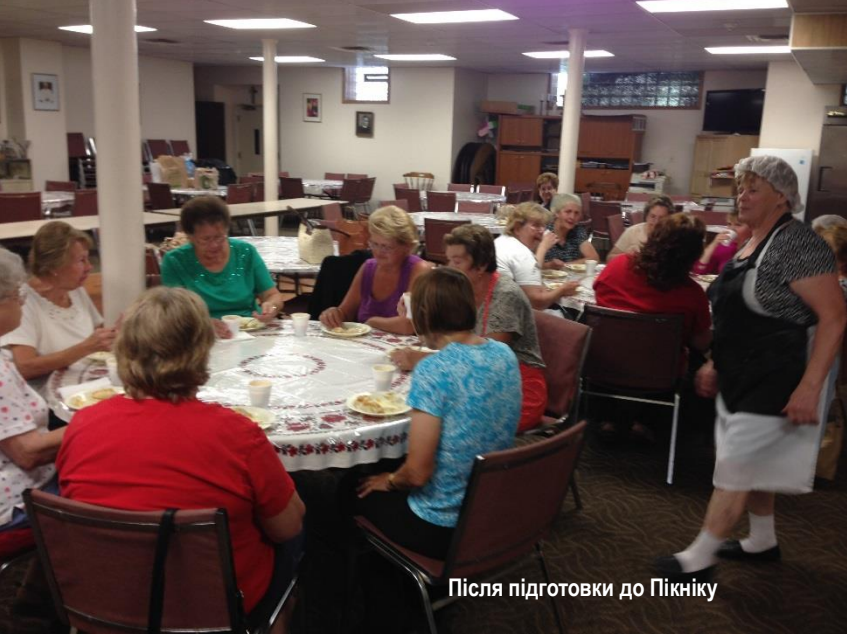
Після підготовки до Пікніку