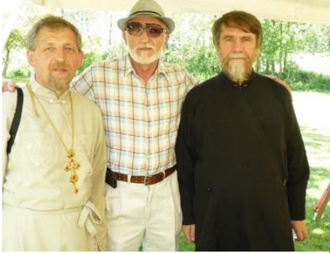
На Фестивалі «Св. Трійці»