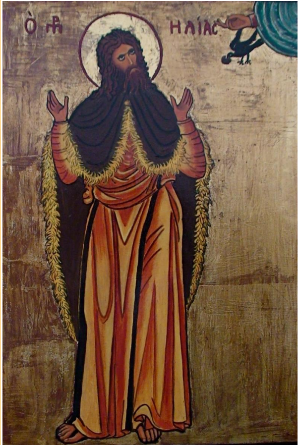
Пророк Ілля – Prophet Elias

CHURCH BULLETIN August 3 – 2014 – 3 Серпня ЦЕРКОВНИЙ ВІСНИК