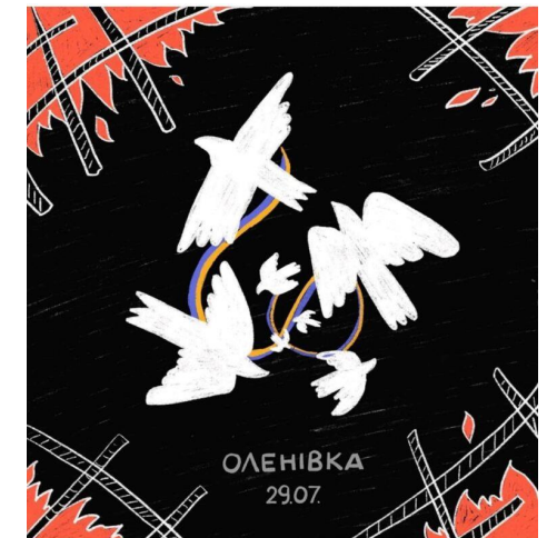
Отець Іван ВИХОП