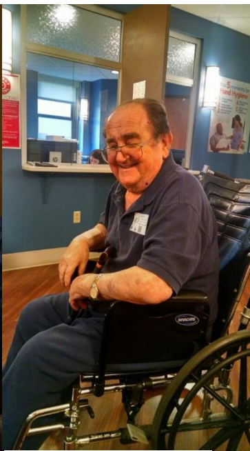
Wishing health and happiness!