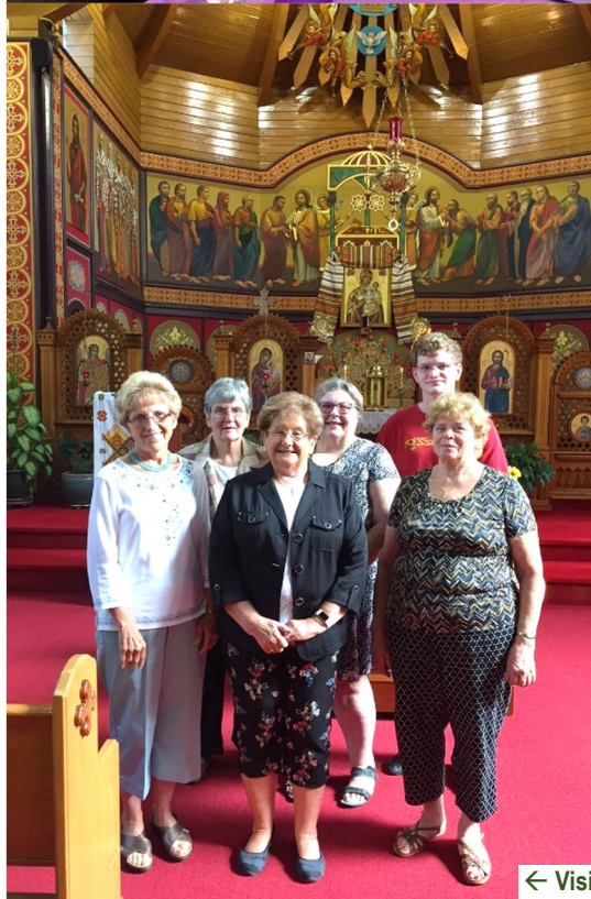
← Visitors from Houston at Dormition Feast