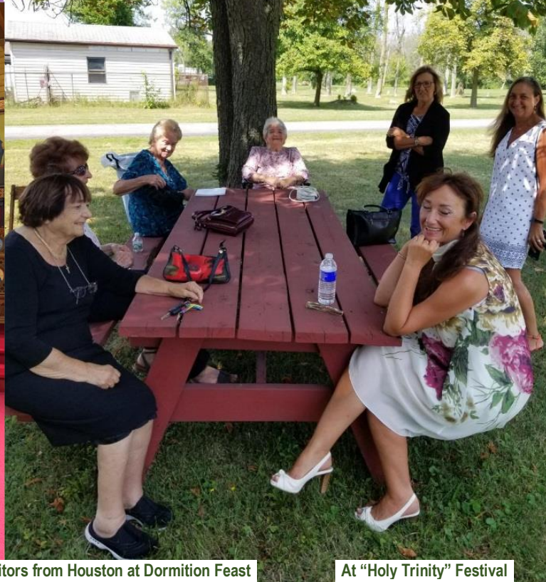
At "Holy Trinity" Festival