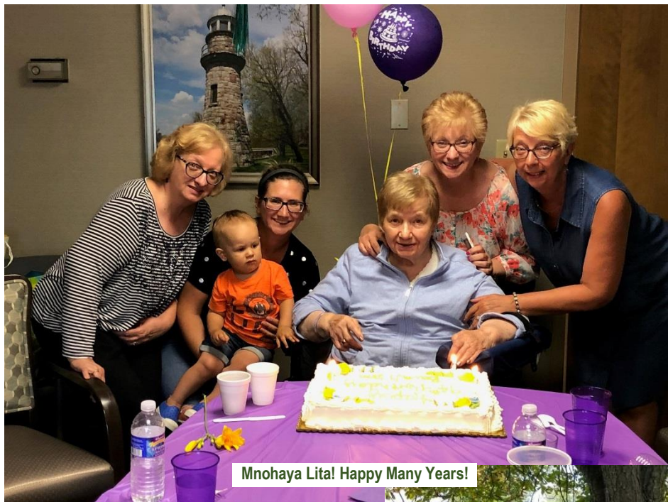
Mnohaya Lita! Happy Many Years!