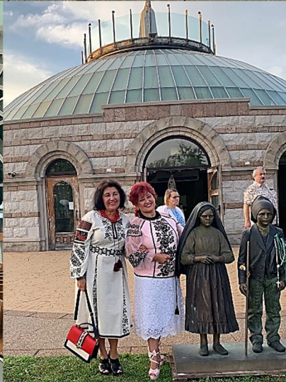
At the Fatima Shrine, August 19, 2021