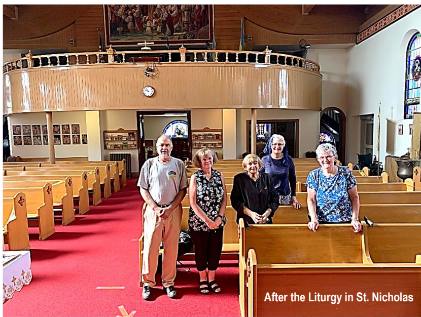
After the Liturgy in St. Nicholas

August 29 – 2021 – 29 Серпня ЦЕРКОВНИЙ ВІСНИК