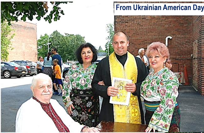
From Ukrainian American Day, August 25, 2019, UHD "Dnipro"