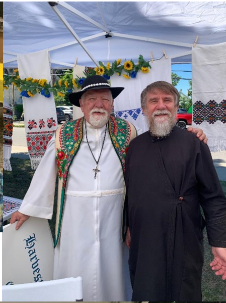
Priests at Ukrainian American Day