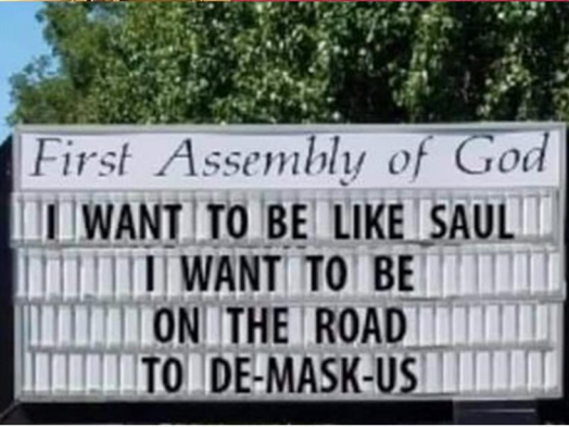
I guess we all have something in common with the First Assembly of God Church ...