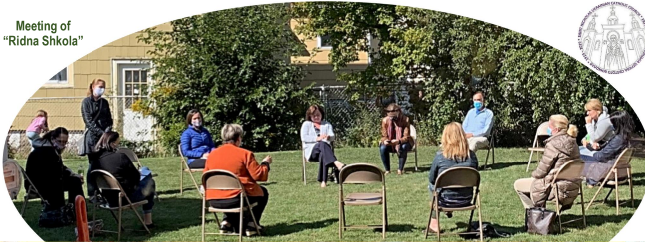
Meeting of "Ridna Shkola"