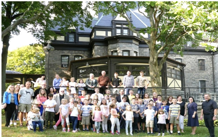
"Children United in Prayer", Stamford – September 29, 2018 – 65 children