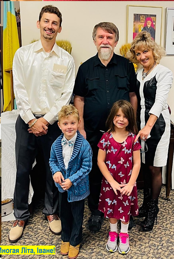
Многая Літа, Іване!