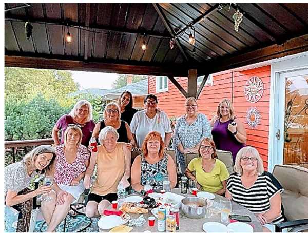
Summer gathering of St. Nicholas Parochial school friends. (August 2021)