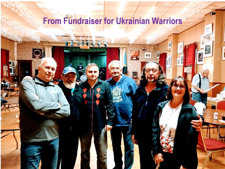
From Fundraiser for Ukrainian Warriors