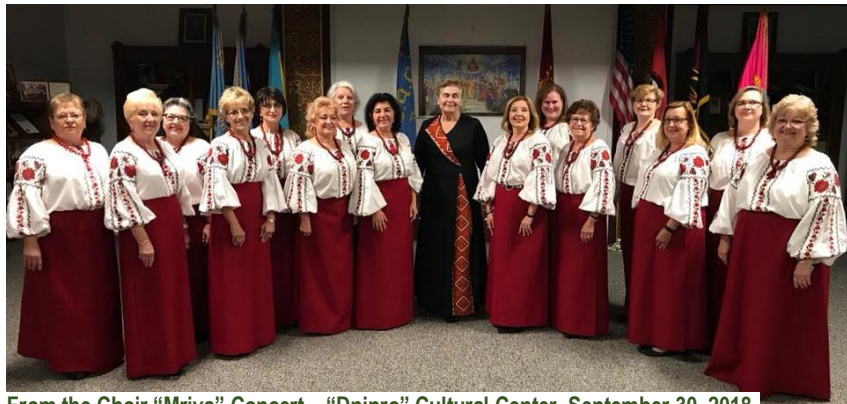
From the Choir "Mriya" Concert – "Dnipro" Cultural Center, September 30, 2018

→ LUC Photos will continue in next bulletin