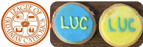
Preparation for the convention