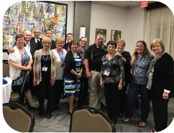
Buffalo River History Tour

LUC Let Us Care League of Ukrainian Catholics