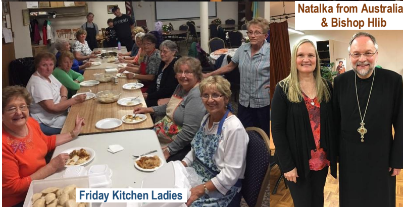
Friday Kitchen Ladies