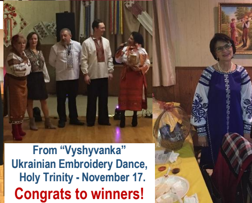
From "Vyshyvanka" Ukrainian Embroidery Dance, Holy Trinity - November 17. Congrats to winners!

SAINT NICHOLAS UKRAINIAN CATHOLIC CHURCH