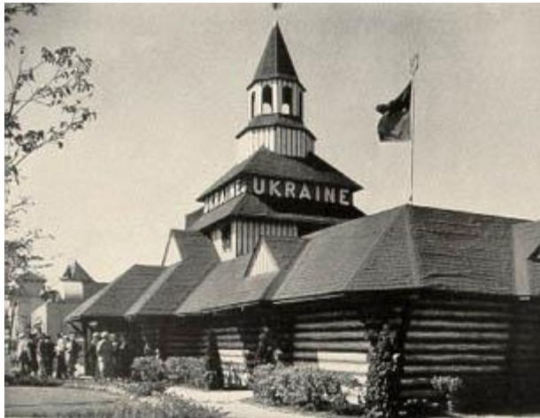
Ukrainian Pavilion 1933 World's Fair in Chicago

May God continue to bless the membership of the League of Ukrainian Catholics and may He continue to guide our youth and elders in all that they set out to accomplish.