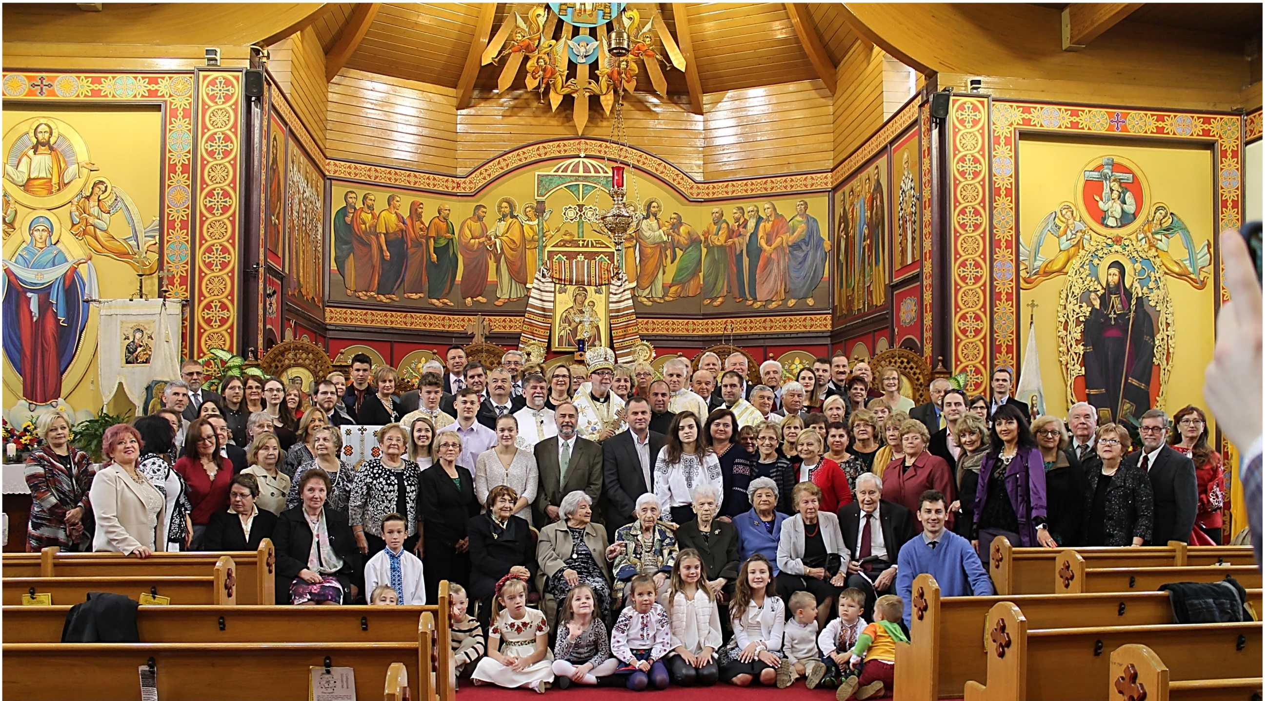
100-Ліття Церкви Св. Миколая і 125-Ліття Парафії – 100th Anniversary of Saint Nicholas Church and 125th Anniversary of the Parish