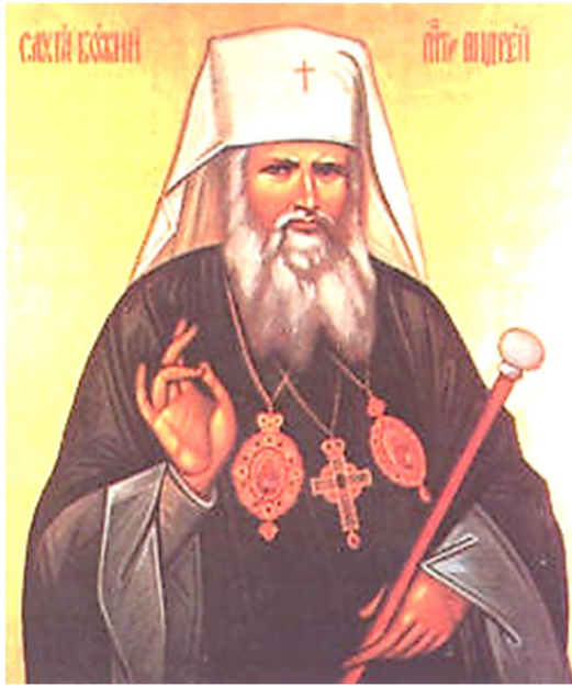
Metropolitan Andrey Sheptytsky, O.S.B.M. Metropolitan of Galicia, Archbishop of Lviv

Metropolitan Andrey Sheptytsky was born Count Roman Alexander Maria Sheptytsky in 1865 in the Ukrainian village of Prylbychi. The son of a polonized (and therefore latinized) Ukrainian Aristocrat, Jan Sheptytsky and Sophia Fredro (daughter of the Polish literary figure), he was conscious of the fact that his ancestors included some notable bishops and Metropolitans of the Greco-Catholic Church of Kyiv. After many obstacles created by his father, the young Count Sheptytsky was able to enter the Ukrainian monastery of the Order of Saint Basil the Great (OSBM) in 1891 and accepted the monastic name Andrey. In 1900 he was made Bishop of Stanyslaviv and shortly afterwards, at the age of 36, became the Metropolitan, i.e. the ranking hierarch of the Ukrainian Greco-Catholic Church. He remained at this post until his death on 1 November, 1944.