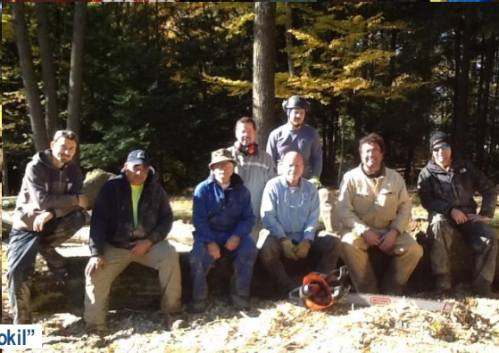
Nov. 4: Working at "Novyj Sokil"

SAINT NICHOLAS UKRAINIAN CATHOLIC CHURCH