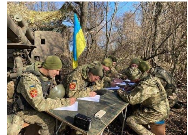
Як українці писали традиційні радіодиктант національної єдності який цього року був присвячений рідному дому.