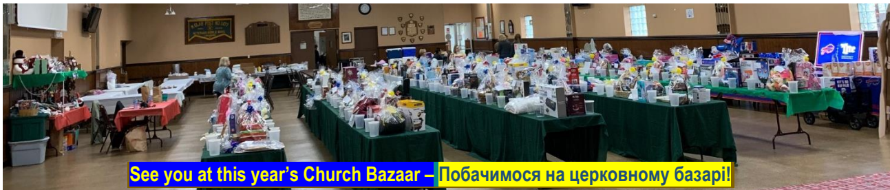
See you at this year's Church Bazaar – Побачимося на церковному базарі!

November 13 – 2022 – 13 листопада ЦЕРКОВНИЙ ВІСНИК