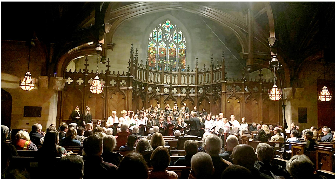
From Prayers for Peace in Solidarity with the people of Ukraine at UU Church in Buffalo, November 17, 2023. Thank You!