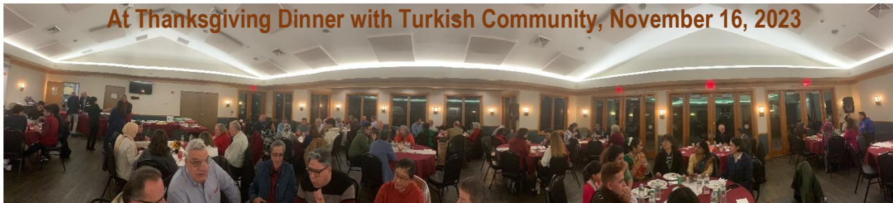
At Thanksgiving Dinner with Turkish Community, November 16, 2023