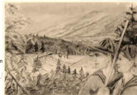
Сокол з картини пл. Сен. М. Борачка

У Українському домі «Дніпро» можна побачити картини Маєстра Мар'яна Юліяна Борачка.