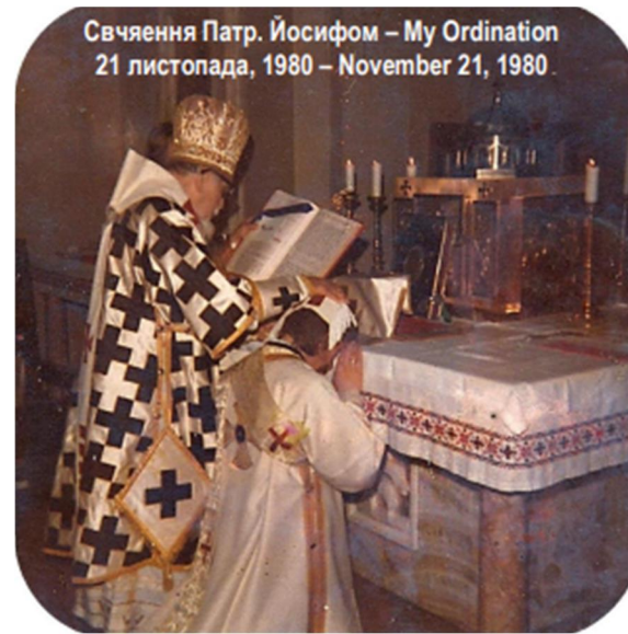
Свячення Патр. Йосифом – My Ordination 21 листопада, 1980 – November 21, 1980